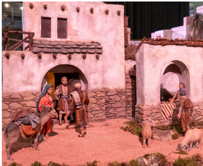
Belén del Ayuntamiento de Madrid

La secuencia propuesta por la Asociación de Belenistas de Madrid comienza con la Anunciación, donde el Ángel Gabriel se presenta a la Virgen María junto a una fuente pública, una evocación de las tradiciones del evangelio del pseudo-Mateo y del Evangelio Armenio de la Infancia, todo enmarcado por el imponente castillo de Herodes. A continuación, se representa la llegada de José y María a Belén, la búsqueda de alojamiento y al posadero que los rechaza. La ambientación frente a un caravasar —un tipo de posada de la época— permite al espectador viajar en el tiempo observando a otros viajeros que pernoctan allí. A continuación, la escena de la Anunciación a los pastores en un redil al aire libre muestra a los guardianes de ovejas alrededor de una cueva, mientras el Ángel les da noticia del nacimiento.