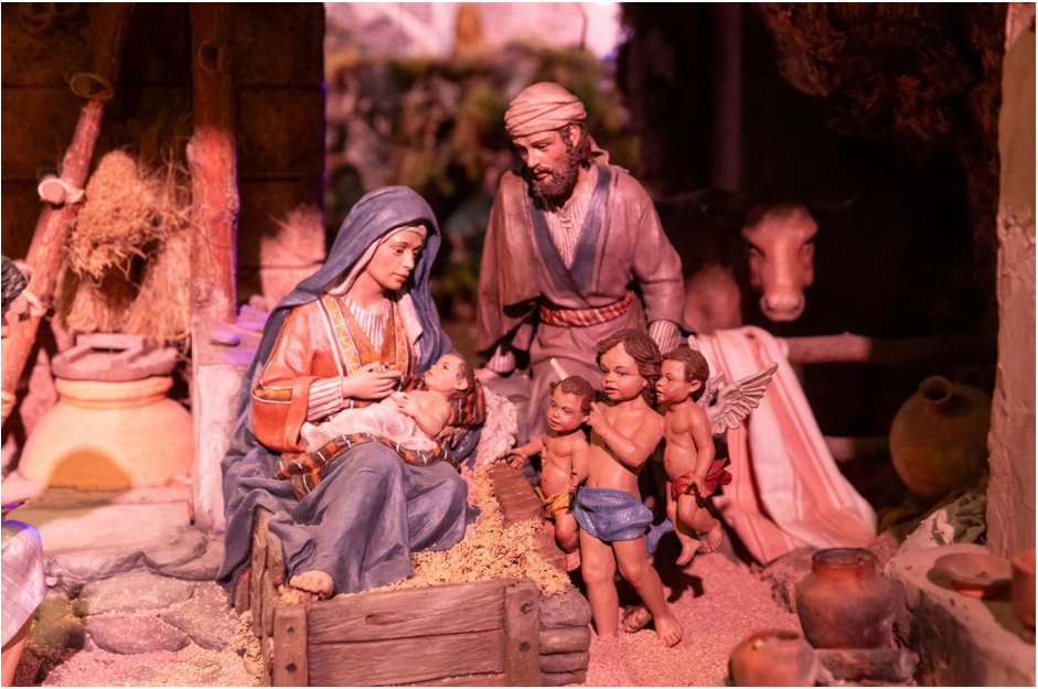
Belén del Ayuntamiento de Madrid

El recorrido sigue con la gran Cabalgata de los Reyes Magos, que avanzan hacia Belén en su misión de honrar al Niño Dios. La escena del Nacimiento evoca el pasaje de San Lucas: “Y lo envolvió en pañales y lo acostó en un pesebre...”.