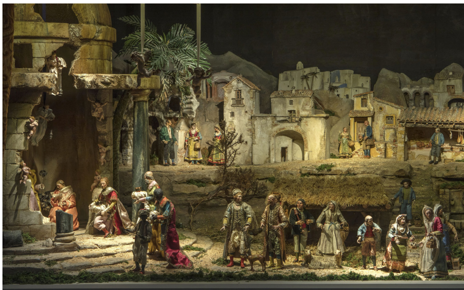
Belén del Museo de Historia de Madrid

En este belén, el Misterio se despliega sobre ruinas clásicas, donde desciende una cascada de pequeños ángeles que añaden un toque celestial. A su alrededor, campesinos, burgueses, pastores, vendedores ambulantes, músicos y el lujoso séquito de los Reyes Magos llenan el escenario, formando un retrato vibrante de la vida cotidiana de la época. Esta obra, en su mayoría anónima pero de excepcional calidad artística, es una excelente muestra del belén napolitano que el rey Carlos III trajo a España y ayudó a difundir.