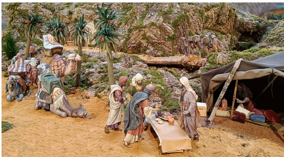
Belén del Museo de San Isidro

Las figuras, realizadas en el reconocido Taller de José Luis Mayo, siguen el estilo hebreo —las que, desde la interpretación de la tradición artesana del XIX, recrean imágenes y vestuario contemporáneos a Jesús— y se distinguen por la meticulosa calidad en su modelado y su exquisita policromía. Cada figura refleja la dedicación y el cuidado artesanal, transportando a los visitantes a un mundo de detalles donde tradición e historia se unen para celebrar la Navidad.